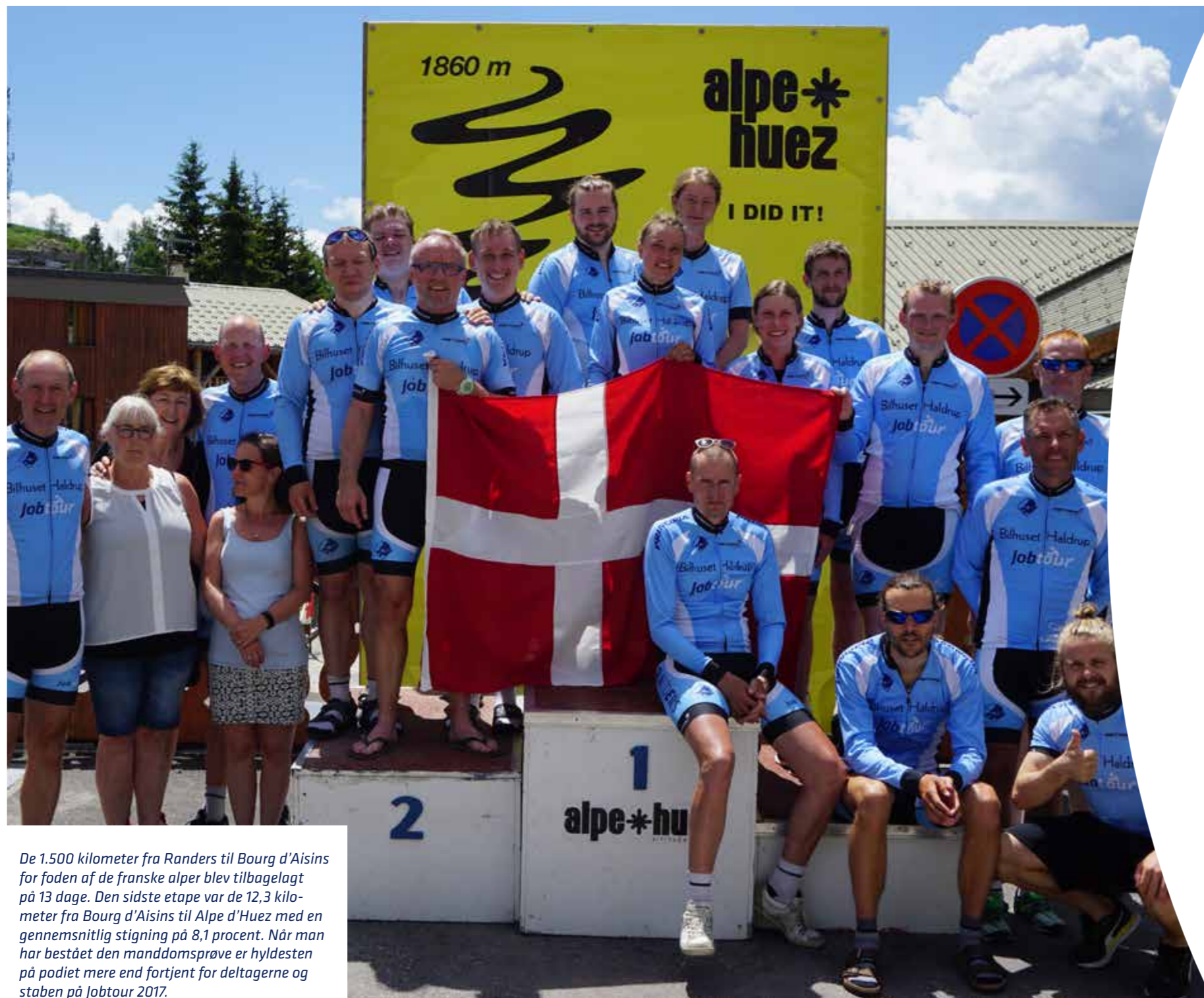
De 1.500 kilometer fra Randers til Bourg d'Aisins for foden af de franske alper blev tilbagelagt på 13 dage. Den sidste etape var de 12,3 kilometer fra Bourg d'Aisins til Alpe d'Huez med en gennemsnitlig stigning på 8,1 procent. Når man har bestået den manddomsprøve er hyldesten på podiet mere end fortjent for deltagerne og staben på Jobtour 2017.