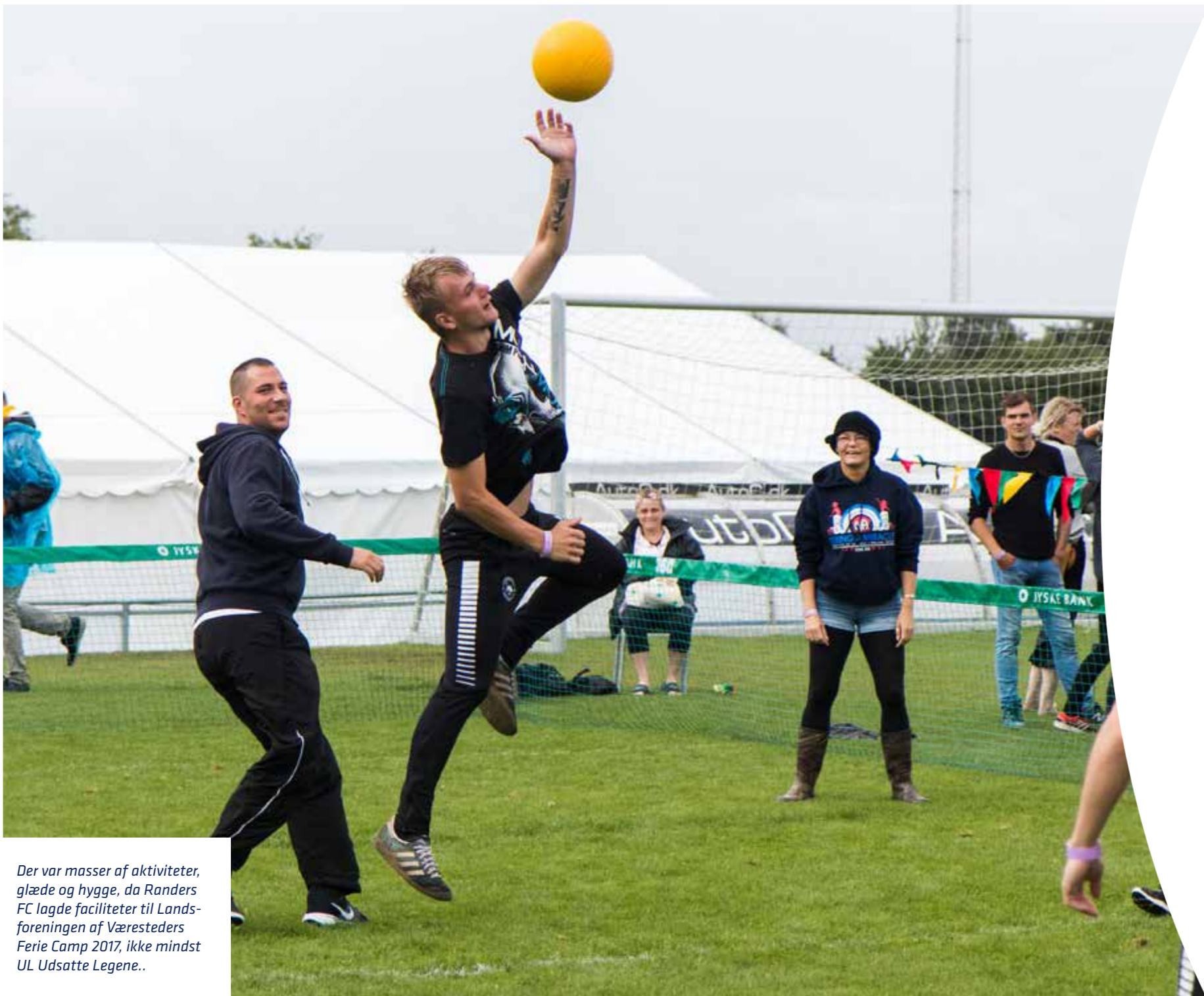
Der var masser af aktiviteter, glæde og hygge, da Randers FC lagde faciliteter til Landsforeningen af Væresteders Ferie Camp 2017, ikke mindst UL Udsatte Legene..